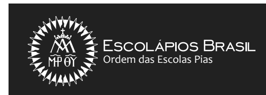
Versão Horizontal Negativa

ESCOLÁPIOS BRASIL Ordem das Escolas Pias