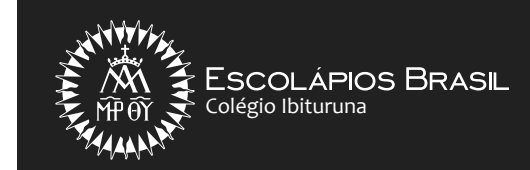
Versão Horizontal Monocromática Negativa